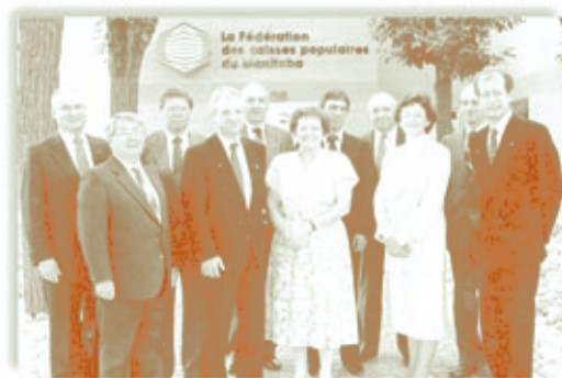
Affiliation des Caisses populaires du Manitoba, juin 1989.

international 20 ». Ainsi, l'expertise de Desjardins dans les systèmes financiers «lui assure la position de leader des coopérateurs francophones minoritaires et en fait un parrain idéal des grandes institutions financières du pays 21 ». Cette influence se traduit en 1989 par une entente qualifiée d'historique et qui fait des fédérations des caisses populaires de l'Ontario, du Manitoba et de l'Acadie des fédérations affiliées. Selon l'entente, chacune conserve son autonomie et a droit à toute une gamme de services. Elles n'ont toutefois pas le droit de vote et ne peuvent remplir aucune fonction électorale à la Confédération. Ces nouvelles affiliations imposent à l'AVD une réflexion sur son rôle de représentant auprès des communautés francophones hors Québec. Quelles formes doivent maintenant prendre ces relations?