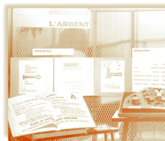
Stand de l'AVD au congrès de l'Association des Commissions des Écoles bilingues d'Ontario, 1964

Au cours des années 1960, l'Assurance-vie Desjardins étend rapidement les régimes d'assurance vie-prêt et d'assurance vie-épargne et capital social dans plusieurs provinces canadiennes 11 . Elle offre aussi, comme au Québec, des assurances collectives et un régime de rentes aux employés des caisses populaires. Le régime d'assurance pour les écoliers, Accirance , lancé en 1958 au Québec, gagne aussi la faveur des membres des sociétés d'épargne et de crédit hors Québec. Le régime est en effet