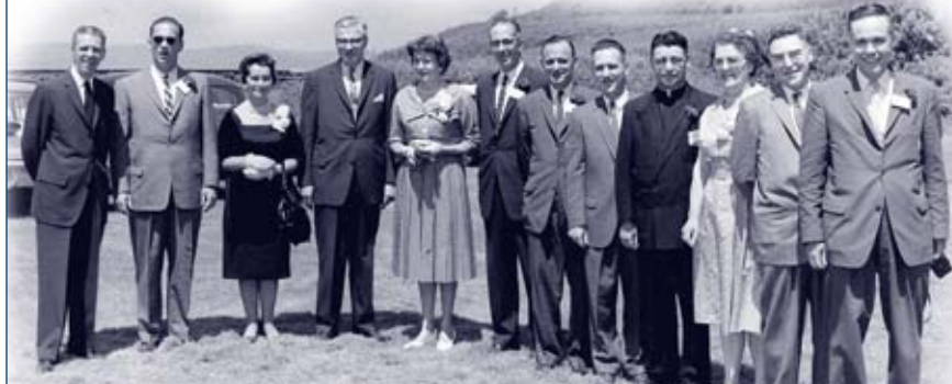
Buffet champêtre en l'honneur d'un groupe de coopérateurs de l'Ouest canadien. Fort Lauzon, 1960.

L'AVD utilise aussi les médias électroniques afin de promouvoir la langue et la culture canadiennes-françaises au Canada. Elle