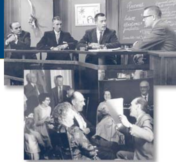
«Joindre les deux bouts», 1959, et «Fête au village», 1961.

commandite l'émission radiophonique Fête au Village en 1960-1964, qui célèbre les arts et les traditions populaires du Canada français. Elle est diffusée par 25 stations de radio au Canada. L'émission de télévision Joindre les deux bouts (1958-1961), qui traite du budget familial, enregistre un épisode en novembre 1958 à la Caisse populaire de Saint-Jean-de-Brebeuf de Sudbury. Elle est diffusée dans 17 stations de télévision au Canada. La diffusion à l'échelle canadienne des activités des francophones contribue à la consolidation de cette communauté de destin dispersée sur des milliers de kilomètres.