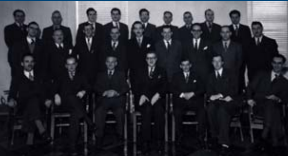
Journée d'étude pour les représentants de l'Assurance-vie Desjardins, janvier 1951.